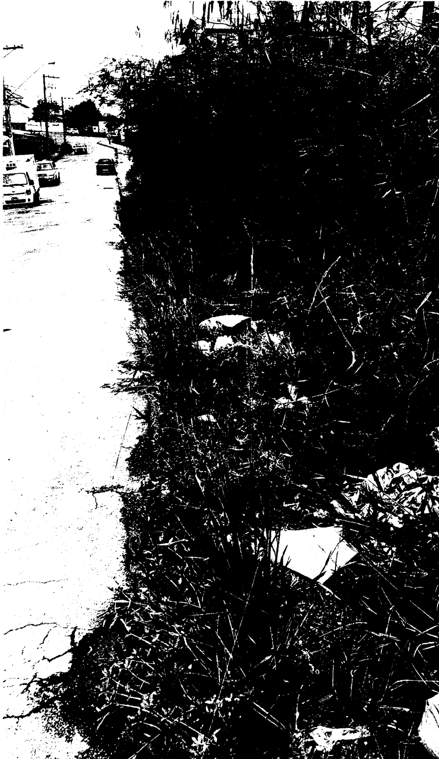
CAPINAÇÃO DE CABEÇAS DE GUIAS E RASPAGEM DE SARJETAS em toda extensão da Rua Expedicionário Francisco Antonio de Oliveira - Jd. Esperança.